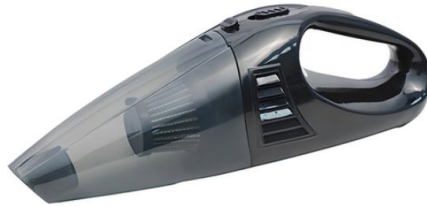
• 진공 청소기