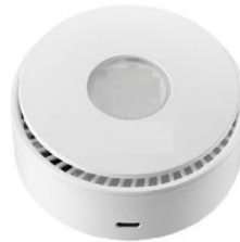
• 공기 살균기