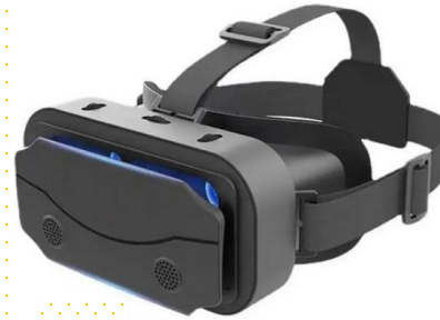
• VR 안경