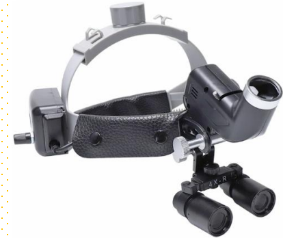
• 치과 안경