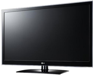
• TV, 모니터